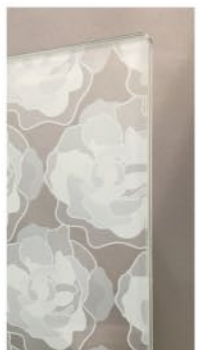
例：白濃淡による表現