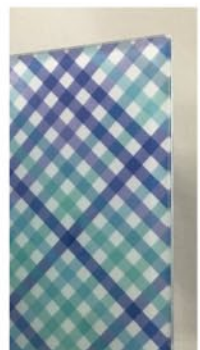
例：色鮮やかな表現