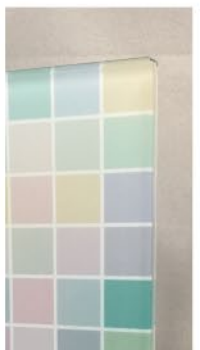
例：パステルカラータイル